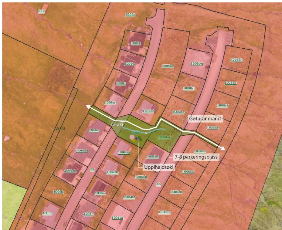
Uppskot til nýtt D-øki millum Hjalla

Løgtingslóg um býarskipanir og byggisamtyktir v.m.