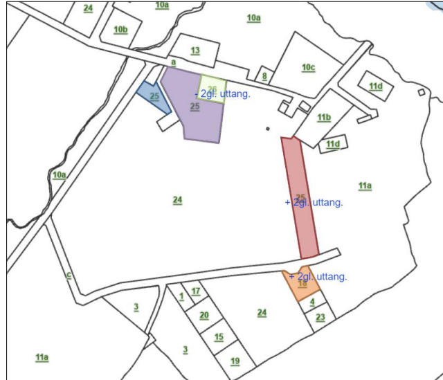
Lutir at býta sundur

avtalan er tíverri ongantíð formaliserað, og eiga arvingarnir eftir hann tískil á pappírinum framvegis lendið undir trafostøðini .